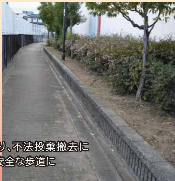
草刈り、不法投棄撤去により安全な歩道に