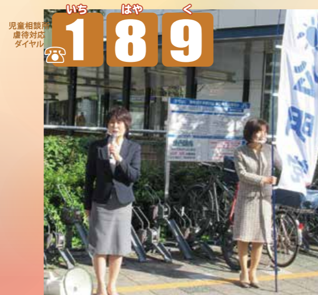
児童相談所虐待対応ダイヤル