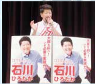
守口エナジーホールにて個人演説会

皆様のおかげで3期目大勝利を飾らせていただくことができました。本当に有難うございました。3期目も全力で仕事をし、皆様にご恩返しをして参ります。課題山積の中ですが、希望と安心の輪を広げていくその先頭に立って走り向いて参ります。(コメントの一部抜粋)