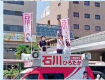
京阪守口市駅前ロータリーにて街頭演説会