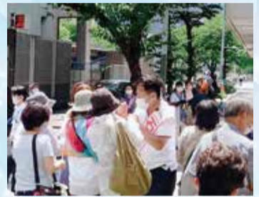
大阪駅第4ビル前にてグータッチを